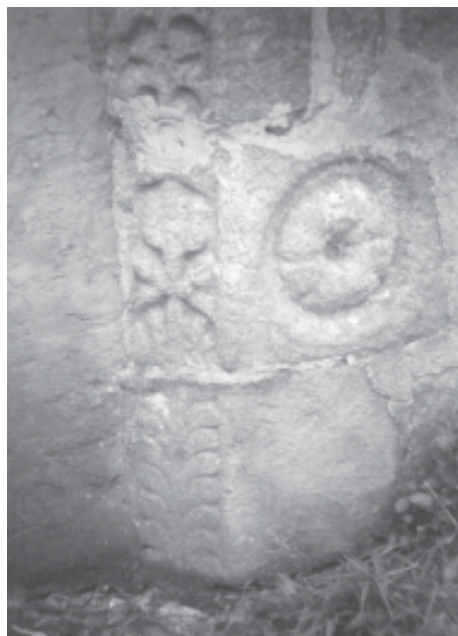
Figs. 5, 6, 7.- Lendo: motivos decorativos das xambas da Porta Norte.

É simplemente debido á proximidade a un lugar onde si tiveron posesións, e á data do documento, 1390, cando aínda o recordo dos templarios podía permanecer fresco na memoria da xente, ou que nos fai traer aquí esta suposición.