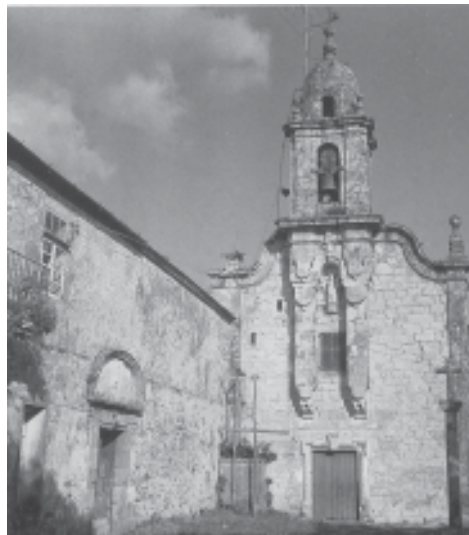
Fig. 11. Igrexa e convento de San Sadurniño, edificados sobre antigas construcións da Orde do Temple.

As citadas son as únicas posesións templarias documentadas. Sen que poidamos facermos unha atribución precisa, hai tamén un documento, nun libro de documentos do mosteiro de Xubia, que fala dunha información sobre propiedades en Caranza, do 12 de setembro de 1375, citándose unha denominada “cortiña das Ordenes..”. Como as únicas ordes militares que teñen un número importante de bens nesta comarca son a do Temple e a do Hospital (esta cun “partido” en Régoa e Teixido), quizais estas cortiñas puidesen pertencer a ambas as dúas institucións, pero non temos a completa seguridade. 25 Pero a bibliografía, ou as tradicións, fan que a presenza templaria se estenda por un amplo territorio. Así, tamén hai quen pensa que en San Vicente da Illa, illa pertencente á parroquia de Santalla de Ladrado, concello de Ortigueira (A Coruña), existiu un