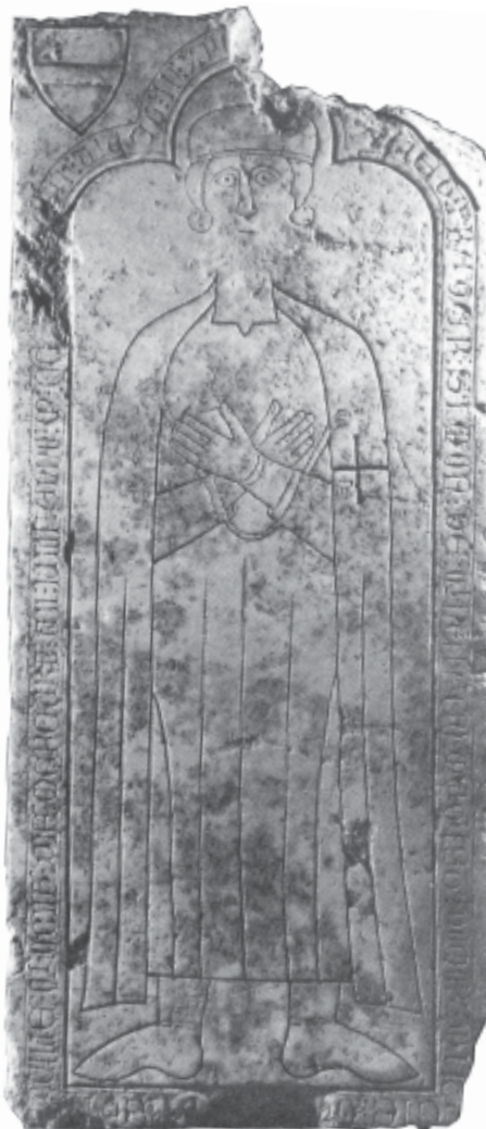
Fig. 15. Lauda sepulcral do sacerdote templario Simone de Quincy.

16 Publicado por Áurea Javierre Mur: «Aportaciones al estudio del proceso contra el Temple de Castilla», Revista de Archivos, Bibliotecas y Museos , LXIX (1961), apéndice III, páxs. 75-76; Fidel Fita: Actas inéditas de siete concilios españoles celebrados desde el año 1282 hasta el de 1314 , Madrid, 1882, pág. 80. Pub. parcialmente: Carlos Pereira Martínez: «A Orde do Temple e Cambre», Esculca , 3 (1994), pág. 41, e Os Templarios. Artigos e ensaios , Noia, 2000, pág. 26.