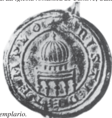
Fig. 16.- Selo templario.