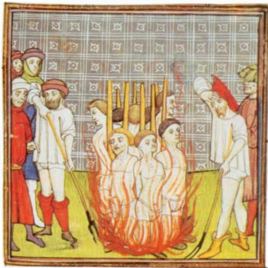
Fig. 12. Execución dos templarios na fogueira.