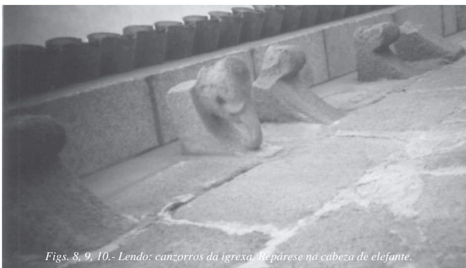
Figs. 8, 9, 10.- Lendo: canzorros da igrexa. Repárese na cabeza de elefante.