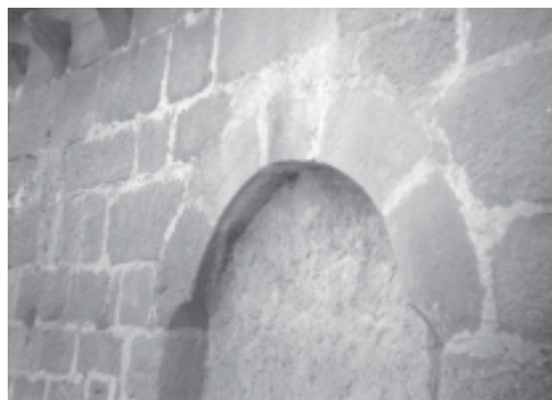
Fig. 4.- Lendo. Arco da Porta Norte.

na Terra de Bergantiños e outros lugares. 4 Neste documento aparece a encomenda constituída, co seu comendador, e fálase de bens templarios nestas paraxes sobre os que exercían a propiedade antes desta data. Hai que supoñer que houbo previamente un proceso de acumulación de propiedades na comarca, que nun principio dependerían directamente da bailía de Faro. Esta circunstancia obrigaría aos templarios a crear, nun lugar máis ou menos céntrico e ben comunicado, e a unha distancia de aproximadamente 30 quilómetros, tal como sinala Demurger ao estudar a estrutura territorial de algunhas encomendas templarias francesas 5 , unha nova sede administrativa para xestionar directamente estes bens. O feito de aparecer Lendo como encomenda en 1241 indica que xa levaría algúns anos funcionando, quizais dúas décadas.