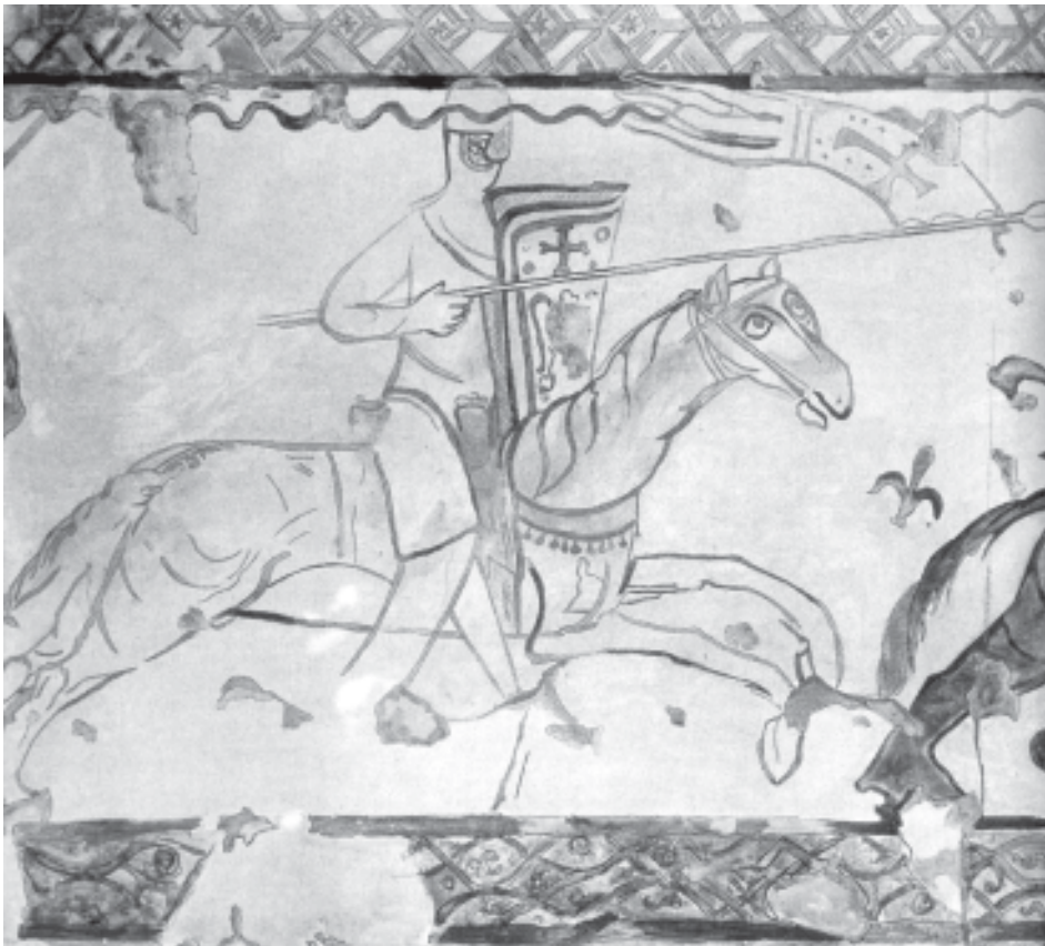
Fig. 2.- Cabaleiro templario.