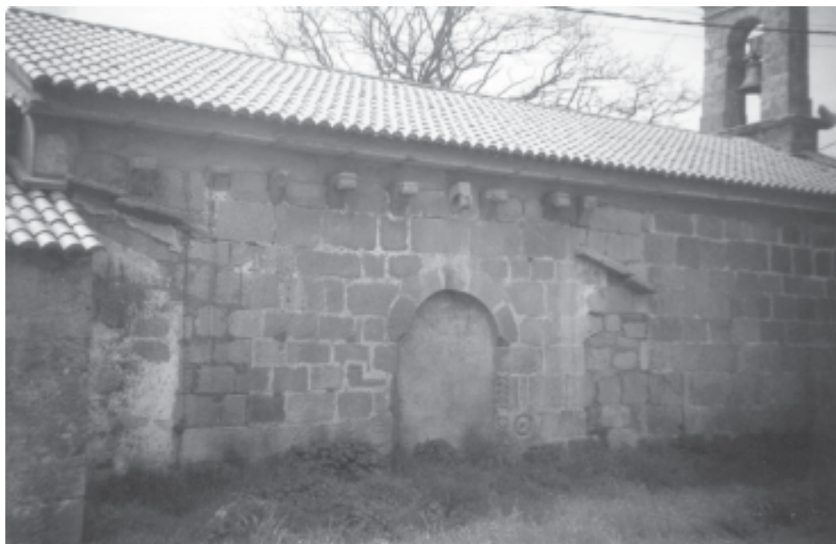
Fig. 3.- Igrexa de San Xulián de Lendo (Laracha, A Coruña). Porta Norte.

Pode semellar excesivo insistirmos tanto na localización xeográfica, pero no caso dos templarios a súa preferencia por emprazar as súas encomendas xunto ás vías de comunicación explicaría que a escolla de Lendo, e non outro lugar, debeuse, a parte das propiedades que alí puidesen posuír, que serían numerosas, á situación estratéxica.