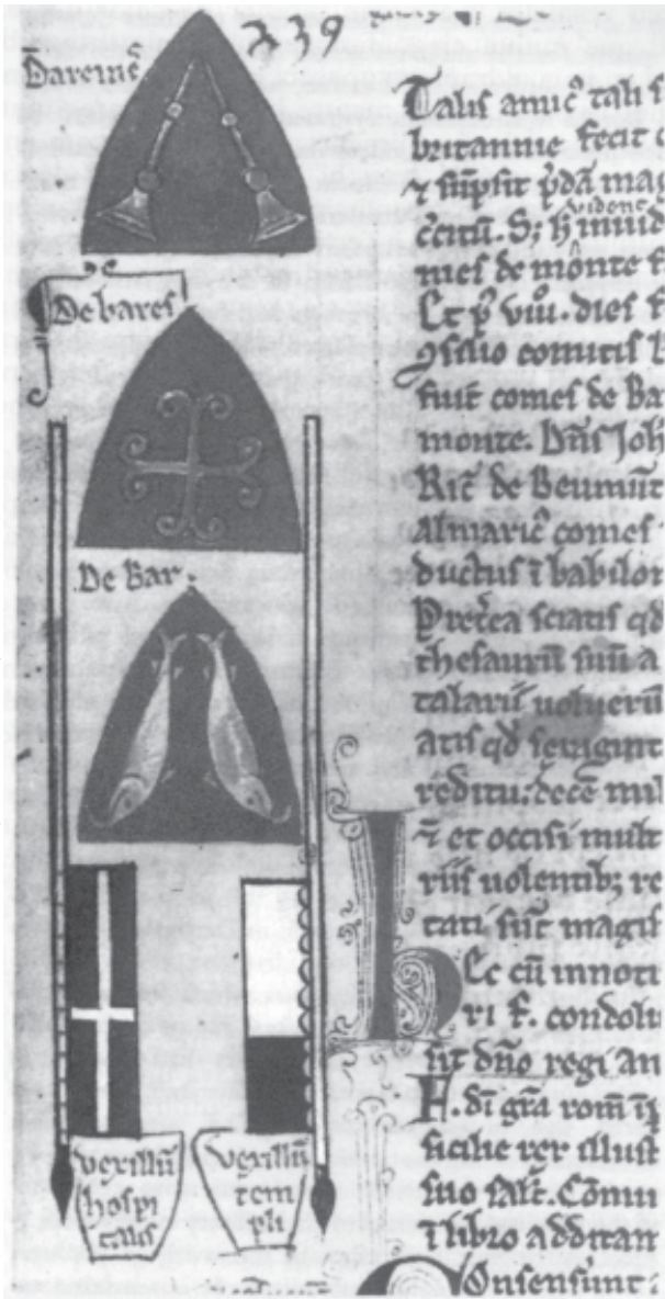
Fig. 13. Abaixo, á dereita, o estandarte templario, chamado «baussant».

Probablemente despois da derrota e morte de Pedro I, e sobretudo coa marcha de Galicia a Portugal de Fernando de Castro en 1371, será cando os Sarmiento recuperen, con toda seguridade por nova doazón -ou confirmación da de Fernando de Castro- por parte de Henrique II, o Burgo de Faro e a súa Terra. En mans da familia Sarmiento permanecía o