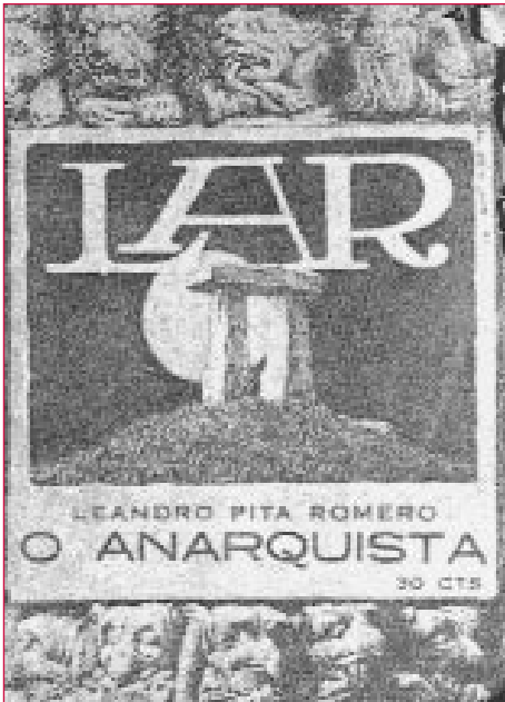
Portada de O Anarquista , A Coruña, 1924, de Leandro Pita Romero, quen tamén escribiu obras de tema político.