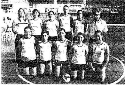
Equipo xuvenil feminino da liga 2007-2008